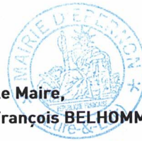
Le Maire, François BELHOMME

Fait et délibéré à Épernon, le 13 mars 2023